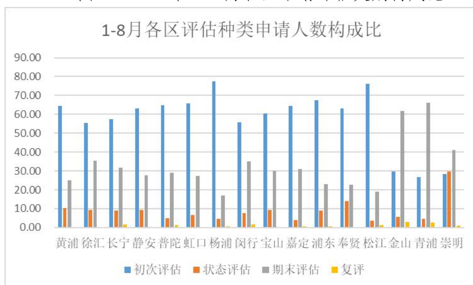
图1 2020年1-8月各区申请评估类别构成比

根据以上31家区级评估机构1-8月上报评估数据统计（奉贤兰公馆、虹口践行和金山来福3家未上报工作数据），共申请评估181357人次，各区申请受理人数占总数的百分比：浦东新区最高27462人次，占全市的15.14%；其次为普陀区18023人次占9.94%；最低为长宁区和嘉定区，分别为6678人次占3.68%和6529人次占3.60%。